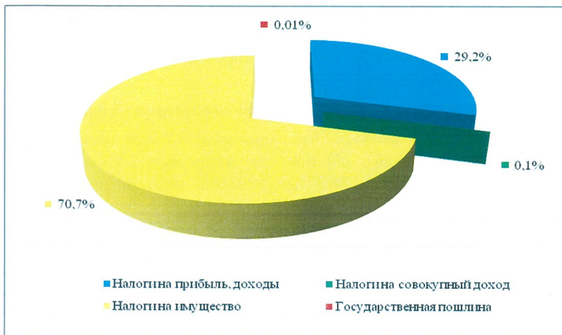
Рис. 1. Структура налоговых доходов, исполненных за I полугодие 2020 года

Налоговые доходы в анализируемом периоде мобилизованы в сумме 5656,7 тыс.руб. (43% от годового плана, 94,5% к уровню I полугодия 2019 года). Структура налоговых доходов представлена на рис. 1.