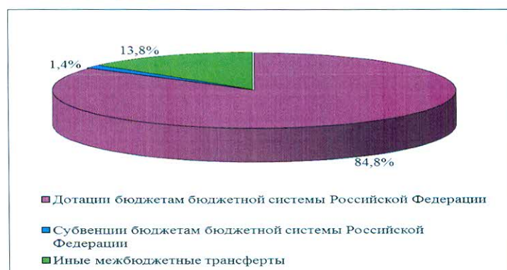
Рис. 3. Структура безвозмездных поступлений от других бюджетов бюджетной системы РФ за 9 месяцев 2020 года

Структура безвозмездных поступлений от других бюджетов бюджетной системы РФ представлена на рис. 3.