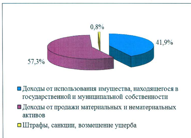
Рис. 2. Структура неналоговых доходов, исполненных за 9 месяцев 2020 года

Неналоговые доходы бюджета за январь-сентябрь 2020 года поступили в сумме 2607,3 тыс.руб. (94,0% от годового плана, в 2,5 раза больше аналогичного периода 2019 года). Структура неналоговых доходов представлена на рис. 2.